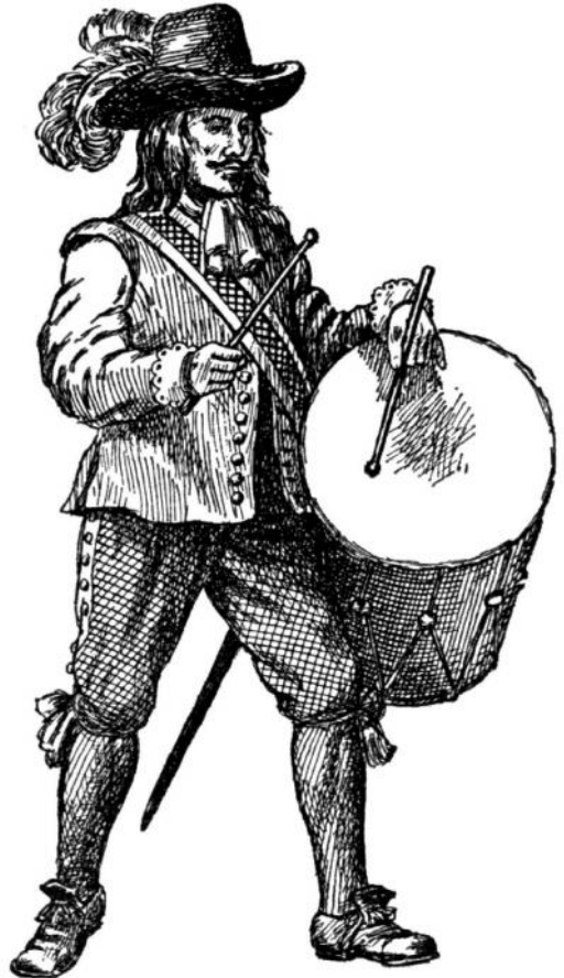
Een 17 de eeuwse tamboer.