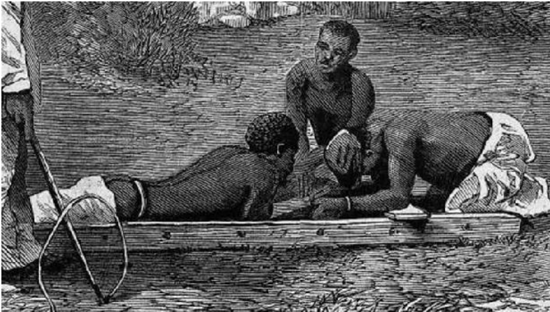
Twee slaven houden een makker vast die wacht op zweepslagen.