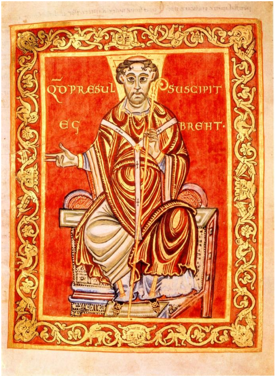
Sint Egbert van Rathmelsigi (plm. 639-729). Zijn feestdag is 24 april.