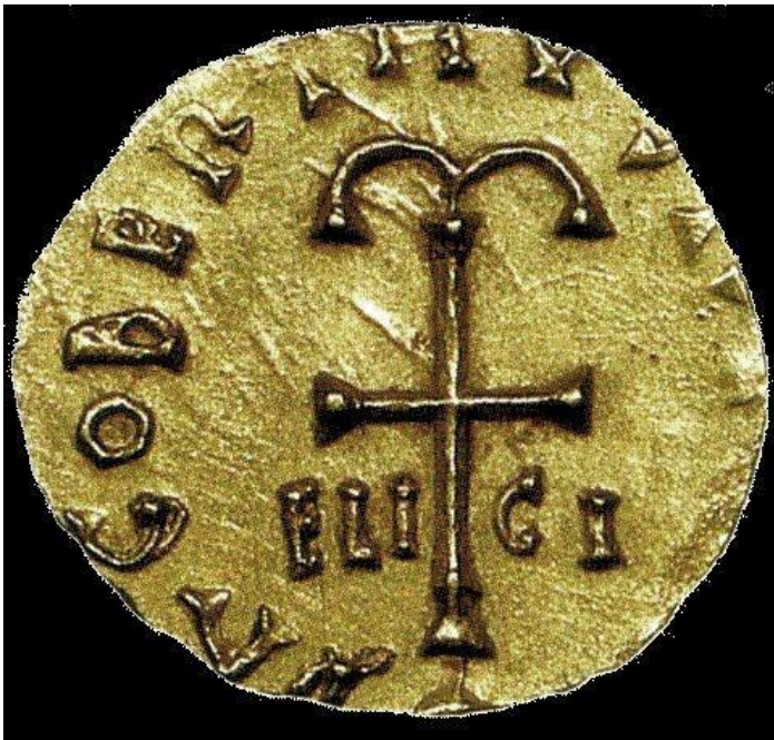
Keerzijde van een munt van koning Dagobert. We lezen 'Eligi', de aanduiding van muntmeester Eligius. Ook Tilman kan de munt hebben geslagen.

In deze periode zal ook de naam Tillo of Tille zijn ontstaan, een verkorting, vertrouwelijke of alledaagse wijze van aanspreken van een drager van de naam 'Tilman'. In het Latijn werd hij ook Tilonius of Hilonius genoemd. De vraag is of dat laatste al tijdens zijn leven zo werd gedaan, of dat van Sint Tilonius een van de t's is weggefallen. Om de verwarring niet te groot te maken hanteren we hier slechts 1 naam, Tilman. Maar men mag ook overal 'Tillo' lezen. Dat is ook de naam waaronder hij als Heilige beschermer is geworden van enkele Vlaamse kerken. Namen als Tielman, Thielman en Dielman zijn eveneens afgeleid van die van Tilman/Tillo.