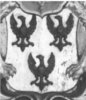
Het wapen van Van Echten en het 'wapenstuk'.

bouw en de verbouwing ( 'Anno 1652 gebouwt, anno 1766 vergroot' ). De tekst zegt niets over vergrotingen van latere datum, en de gebruikte lettering is eerder 18 de dan 17 de eeuws. Wat verder opvalt is, dat het schild, omgeven door een cartouche, vrij leeg is. Twee opmerkingen over bouw en verbouw, en dat is het. Het was esthetisch gezien mooier geweest om grotere letters te gebruiken of deze kleinere lettering aan te brengen op een kleiner vlak, als we er tenminste van uit gaan dat het de bedoeling was dat de steen er zo