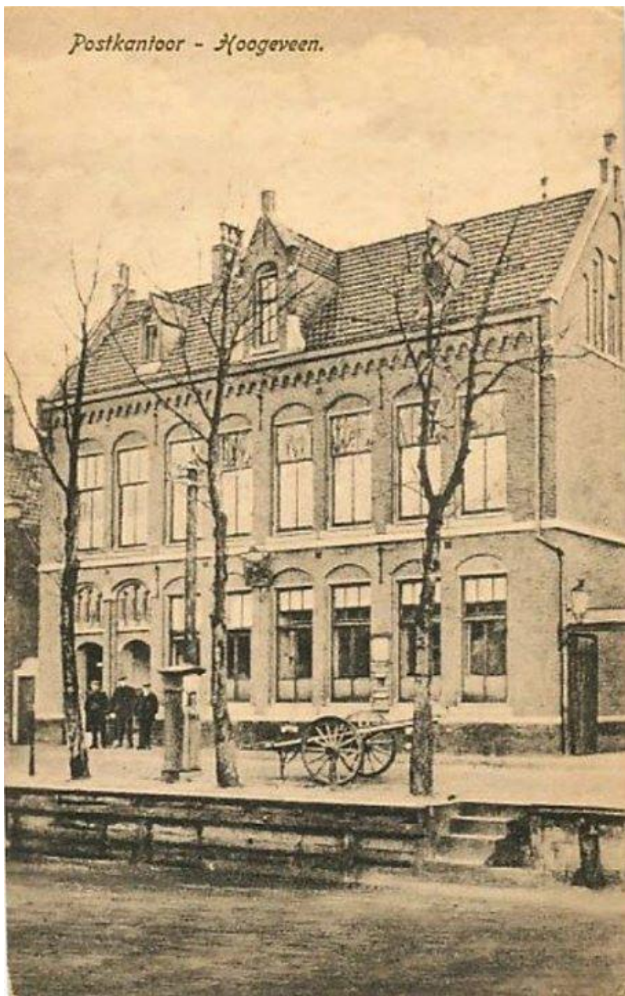
Postkantoor - Hoogeveen.