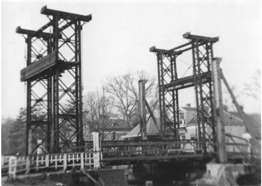
Bruggen als deze Baileybrug, tussen de Zuiderweg en de Van Limburg Stirumstraat, lagen ten westen en ten oosten van de plaats over de Hoogeveensche Vaart, en zorgden zo voor een omsingeling van de 4500 manschappen in Hoogeveen.

Vrijdag 14 april. Twee van mijn Georgische kameraden rekten zich bij het eerste licht eens lekker uit, en vielen terug in de loopgraaf met een kapotgeschoten hoofd. De vijand had onder de dekmantel van het donker geschutsposten en mitrailleurstellingen ingegraven in het veld ten zuiden van de vaart, op schootsafstand van de onze. Ze schoten op alles wat bewoog. Tegelijkertijd braken de beide bruggehoofden ten westen en ten oosten van Hoogeveen door de Duitse linie heen, zodat we nog voor de zon fatsoenlijk op was helemaal omsingeld waren. Onze tanks rolden in de eerste morgenuren op de vijand af. Op twee punten werd vreselijk slag geleverd. De namen daarvan ken ik niet, maar het was op een half uur lopen van Hoogeveen. Onze troepen gingen eervol ten onder. We zagen de zwarte rook vanuit onze loopgraven over ons heentrekken. Gillende Duitsers, die elkaar afmaakten omdat ze zich over wilden geven en anderen dat weer niet wilden, nog weer eens een aanval met jachtvliegtuigen, bommen en raketten vanuit de lucht, en toen de gevechten van man tegen man, bajonet tegen bajonet.