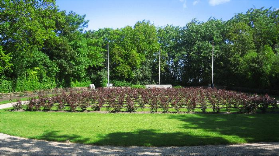
Eén van de drie identieke massagraven bij Hooageveen.