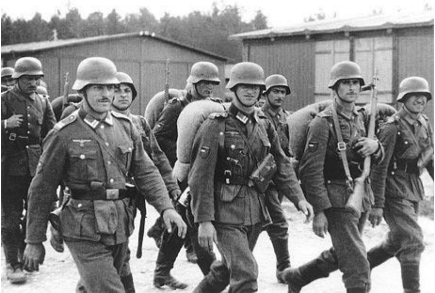
Georgische soldaten, in rustiger tijden, toen ze nog op Texel lagen.

raders? Kunnen we dan wel terugkeren. Laten we door in opstand te komen niet zien dat we géén verraders zijn, maar wat moesten in een onmogelijke situatie? Of moeten we juist kiezen voor trouw aan de Duitsers, door een moedige daad te stellen? De Russen hebben ons land bezet, en die Russen vertrouwen ons nooit weer. Maar door overtuigd te kiezen voor Duitsland, krijgen we in ieder geval een kans op een nieuw leven in de naoorlogse Duitse staat, hoe die er ook uit mag zien. We kozen voor het laatste.